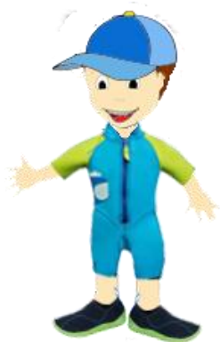
Une combinaison et des chaussons seront confiés à votre enfant

Un livre ludique personnalisé vous permettra de suivre l'évolution de votre enfant