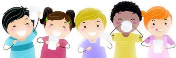
Goûter offert à la fin de chaque séance